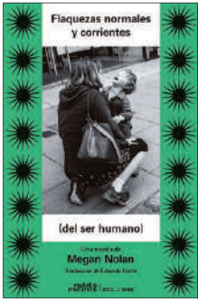
Flaquezas normales y corrientes Megan Nolan Mutatis Mutandis . 20,80 €

Finalista del Women's Prize For Fiction, entre lo mejor del año para Vogue , The Guardian o The Times , es la segunda novela de Megan Nolan, «la autora millennial a la que todo el mundo debería seguir de cerca». Ambientada en el Londres de 1990, donde una niña aparece muerta en una urbanización, la protagonista es la hermosa Carmel, enfrentada a los silencios de su familia de inmigrantes irlandeses.