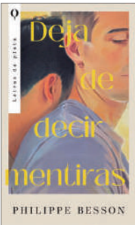
Deja de decir mentiras Philippe Besson Letras de Plata 16,50 €

De paseo por su región natal, el narrador, que no es otro que Philippe Besson, ve en el vestíbulo del hotel a un joven cuyo parecido con su primer amor lo golpea como un puñetazo. A partir de ahí, retrocede 25 años hasta el primer encuentro entre dos adolescentes opuestos: uno, más bien tímido, es un alumno aplicado y lector empedernido; el otro es rebelde, carismático y triunfa entre las chicas.