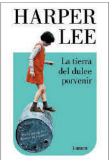
La tierra del dulce porvenir Harper Lee Lumen 20,90 €

La tierra del dulce porvenir reúne todos los cuentos inéditos que durante décadas estudiosos de la obra y biógrafos de Harper Lee daban por perdidos y que aparecieron en su apartamento tras su muerte, así como los ensayos que la autora de Matar a un ruiseñor escribió y que incluyen desde reflexiones sobre la necesidad de una enseñanza responsable hasta retratos de Gregory Peck y Truman Capote.